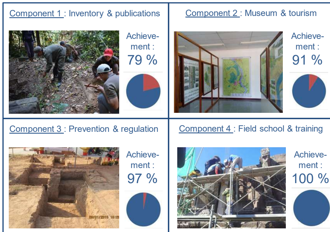
Fig. 2 : Avancement des principales composantes du projet FSP au 1 er mai 2017