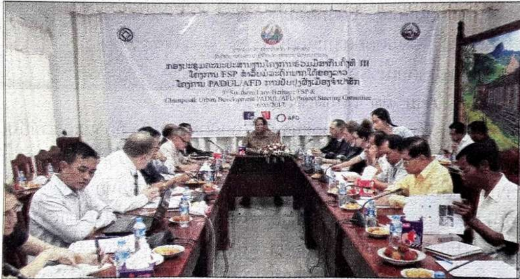
ແຂວງຈຳປາສັກຈັດກອງປະຊຸມ ມໍລະດົກໂລກພາກໃຕ້ ( FSP ) ແລະ ສະຫຼຸບວຽກງານໂຄງການການຮ່ວມມື ໂຄງການຊ່ວຍເຫຼືອເພື່ອການພັດທະນາສາກົນຄັ້ງທີ III ຄືໂຄງການບູລະນະ